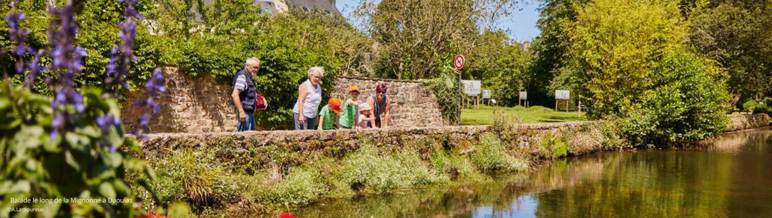
Balade le long de la Mignonne à Daoulas