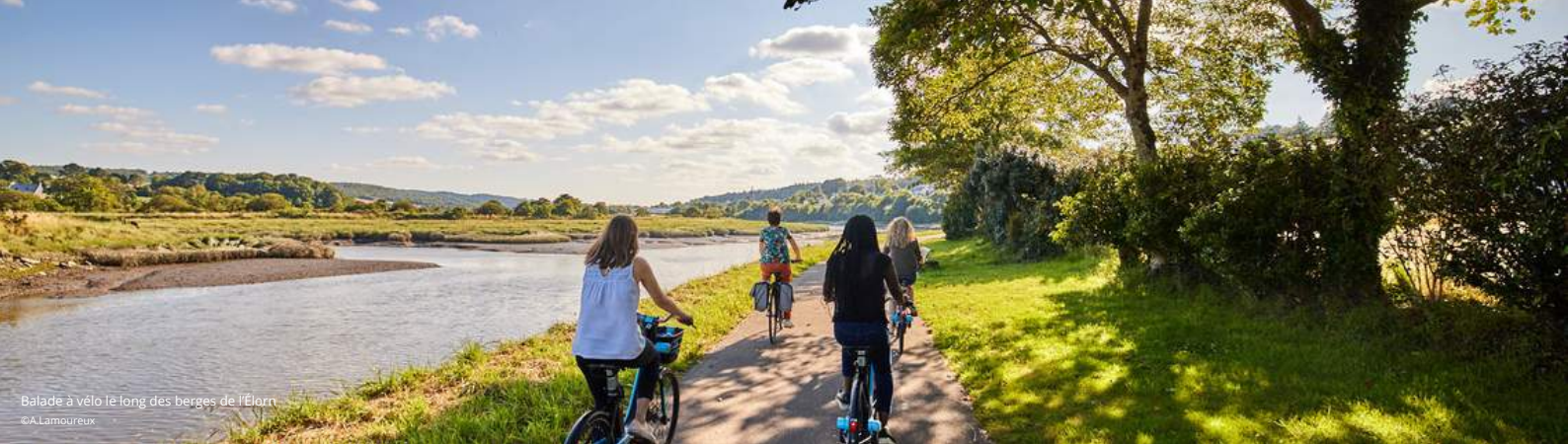
Balade à vélo le long des berges de l'Elorn